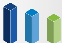
1. Jahr 2. Jahr 3. Jahr Ersparnis beim Wechsel zu einem Abonnement